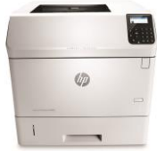
HP LaserJet Enterprise M606dn

Impulse los resultados comerciales y produzca una calidad de impresión superior. Ocúpese de trabajos grandes y equipe a grupos de trabajo para alcanzar el éxito, dondequiera que el negocio lo lleve. Administre y amplíe con facilidad esta impresora súper rápida y versátil, y ayude a reducir el impacto ambiental.